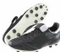
Crampons « moulés » Terrain sec ou dur

Pour entretenir ses chaussures de foot et les faire durer plus longtemps :