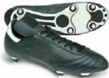
Crampons « vissés » Terrain gras ou humide