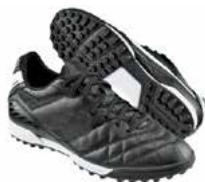
Crampons « stabilisés » Terrain synthétique